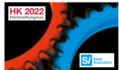
Härtereikongress + Steel Innovation 11. – 13. Oktober 2022