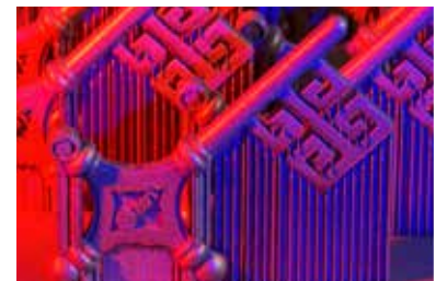
AWT-Konferenz Additive Fertigung 29./30. Juni 2022