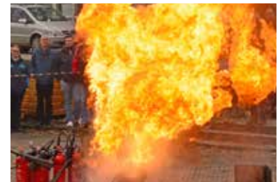
AWT-Seminar – Arbeits- und Betriebs-sicherheit in der Wärmebehandlung am 30./31. März 2022